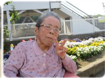
東棟棟活動 作品制作